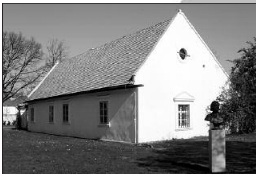
Liszt Ferenc szülőháza

Csodagyerekként indult, már nyolcévesen komponált és még nem volt tíz éves, amikor az arisztokrácia kastélyaiban kézzel a kézre adták a kis zongoraművészt. Az Eszterházyak pozsonyi kastélyában kezdte, ahol szerencsére néhány zeneszerető mágnes pénzügyi támogatásával elindulhatott pályafutásán. Éjjel-nappal gyakorolt és neves tanítómesterek jóvoltából tovább fejlesztette Pozsonyban, majd Bécsben, végül befejezve Párizsban azt az istenáldotta tehetséget, amit a zongorajáték virtuóz fokának neveznek.