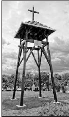
Harangláb és a harang a második márványtáblával

A harangláb elkészítésének költségeit is a Mátyus család vállalta magára, s ennek emlékére tűzzománc címerpajzzsal ékesített emléklapot avattak a templomban és a haranglábban is. Az emléklapokat Kaposváron készítették.