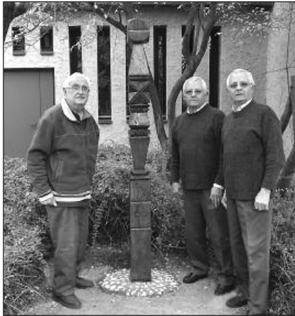
A kopjafa az új helyen

Érdeklődéssel hallgattuk a kopjafa jelképeiről szóló tájékoztatást és azt is, hogy a kopjafát alulról felfelé kell olvasni: