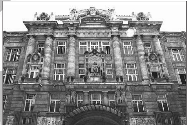
Liszt szobra a Zeneakadémia főhomlokzatán

A magyar zenei életnek elsődrendű támogatója, a Zeneakadémia felállításában kiemelkedő része volt. Életének utolsó éveiben a Pest–Weimar–Róma háromszög vonalában élt. Nem valósult meg a házassági terve Wittgenstein hercegnővel, talán ez is hozzájárított ahhoz, hogy 1865-ben – 54 éves korában – világi papi pályára lépett. Persze megmaradt a zene mellett, „isten muzsikusa” lett. Sokat komponált szimfonikus költeményeket, oratóriumokat, miséket, zongoradarabokat, etűdöket, koncerteket, rapszodiákat. Tanítványai mindig voltak. Még 19 évet élt, sokat volt Pesten, ahol a közönség kedvence volt, de érdekes, nem minden vonalon, mert Ferenc József koronázásakor nem kapott meghívót a Mátyás templomban tartott ünnepi misére, ahol pedig az ő „Koronázási misé”-je volt a szertartás zenéje.