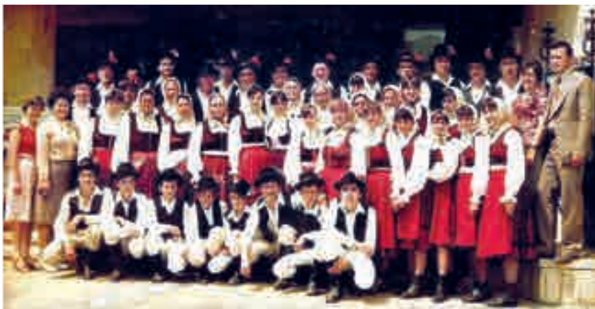
Csoportkép - A Királyfalvi tánccsoport az 1980-as években