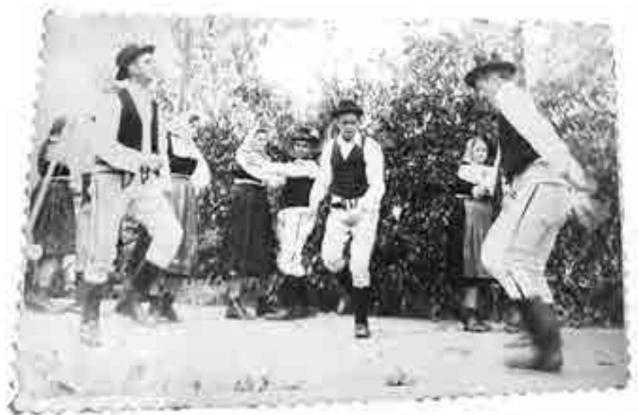
Királyfalvi pontozó férfiak: