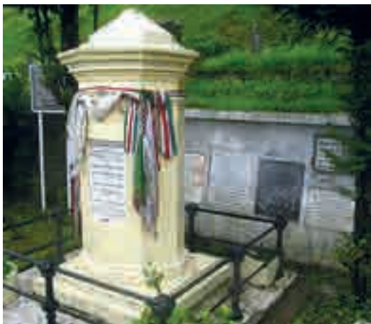
Sírja Dardzsiling városában

1819 őszén indult útnak gyalog, csekély pénzzel. Törökországon, Iránon, Afganisztánon és Indián keresztül Nyugat-Tibetig (Ladák) jutott, ott azonban anyagi eszközök híján vissza kellett fordulnia. Ekkor találkozott W. Moorcroft angol utazóval, aki a tibeti nyelvkutatásra terelte figyelmét. Ladák Zanszkár tartományában, a zanglai lámakolostorban 1823–24-ben, kegyetlen nélkülözések közt eltöltött két esztendő alatt rakta le a tibeti nyelvészet alapjait. 1825–26-ban Tetha zanszkári faluban és a phuktali lámakolostorban, majd Kanamban (1827–30) egészítette ki tanulmányait, elkészítve az első tibeti nyelvtant és a tibeti-angol szótárat.