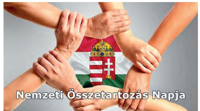
Nemzeti Összetartozás Napja