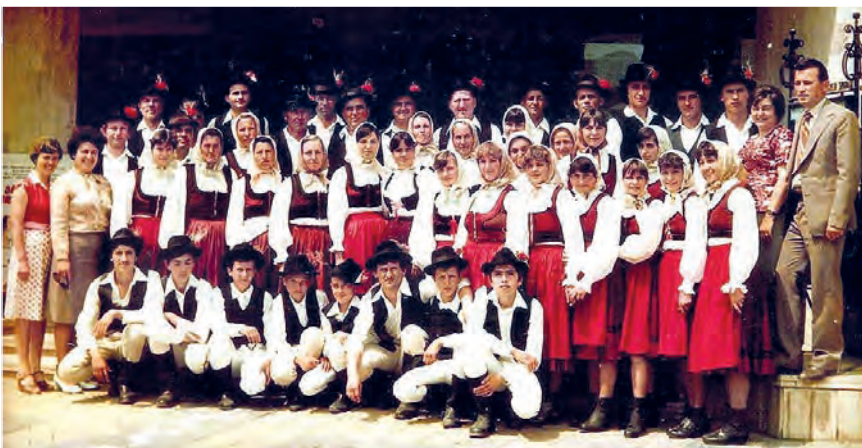
Csoportkép - A Királyfalvi tánccsoport az 1980-as években