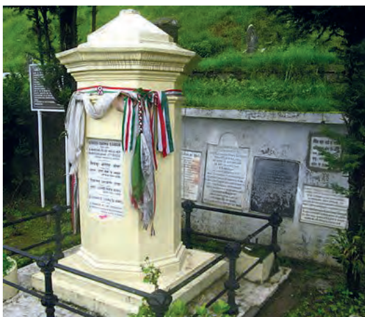
Sírja Dardzsiling városában