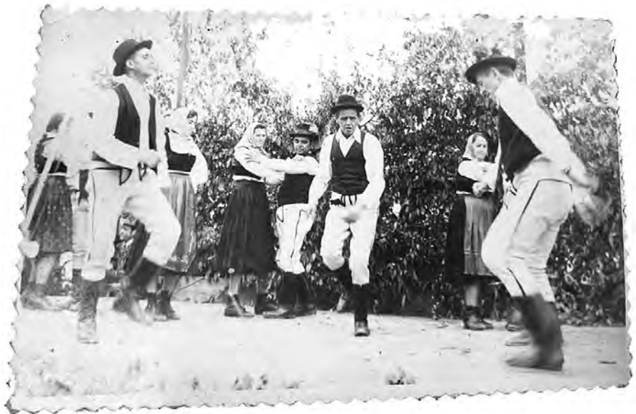
Királyfalvi pontozó férfiak: