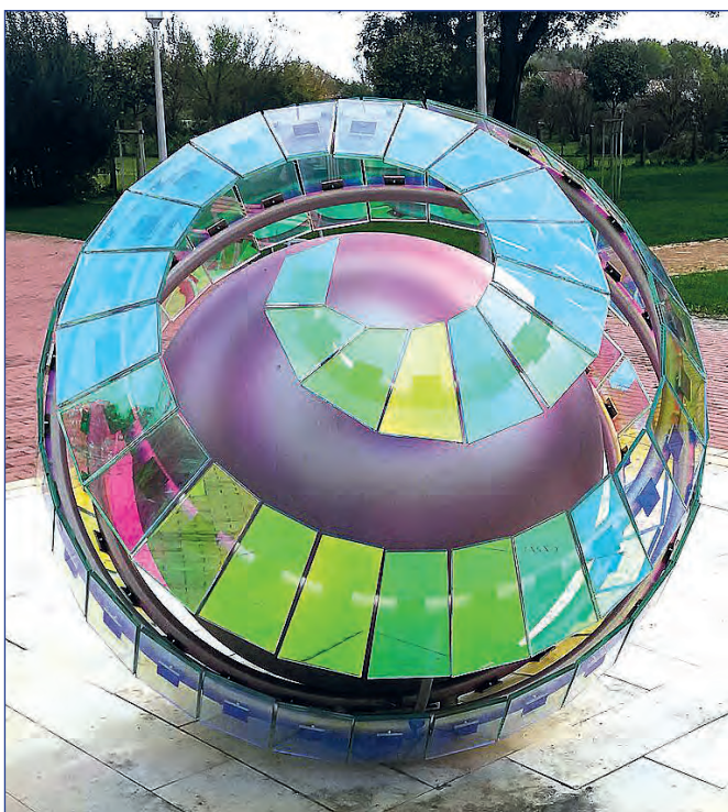
Balogh Eleonóra „Kohézió” című üvegszobra, a nemzeti összetartozás emlékműve Örkényben