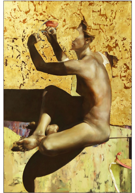
Lásd, mi lesz

Európát, éppen sokszínűsége miatt, számos ilyen közös hovatartozás jellemzi, és ez akár erősítő eleme is lehet az egységes Eu-